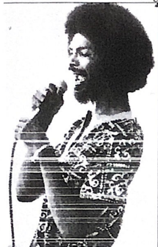
Befreiung entgegengesetzt: "Was wir suchen ist Selbstliebe und Selbstrespekt. ein Lebensstil, der das Leben und nicht Tod zum Mittelpunkt hat, die Liebe und den Hass..." "ho'll Pay Reparations On My Soul?" fragt Scott-Heron auf seinem Debutalbum nall Talk At 125th And Lenox ."