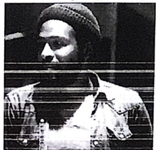
viel konkrete Parteinahme war der weißen erschaft im Gegensatz zum eher globalen anismus von "What's Going On" öffentlich nicht geheuer. Die Single konnte anders als das Album ausschließlich in schwarzen R'n'B Charts positionieren.

D.U.L. on der Name dieser Funk-Combo aus eland reflektiert das Bedürfnis nach warzer Selbstdefinition, eine der Gemeinkeiten der äußerst amorphen Black er Bewegung. "Tell it like it is" mahnt zur gkeit angesichts der Rückschläge der IRON GO Rare Groove aus dem Jahre 1973, dessen el eine Zeile aus einem alten amerikanischen Spiritual aufnimmt: "Let People Go". einer Zeit, in der Polizei und Justiz tliche radikale schwarze Organisationen Gewalt zerschlagen, gewinnt das biblische Gleichnis von Moses, der sein Volk aus